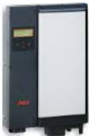
Código: 2403 Inversor ON GRID Steca Grid 2000 Master Monofásico 220 Volt 50Hz