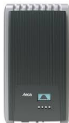
Código: 2405 Inversor ON GRID Steca Grid 3600 Monofásico 220 Volt 50Hz