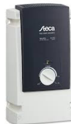
Código: 0002 Inversor OFF GRID Steca Solarix 550i 550W onda sinusoidal