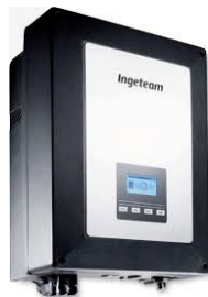
Código: 2501 Inversor ON GRID Ingecon Sun 2,5 TLM de 2,5kW