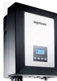
Código: 2503 Inversor ON GRID Ingecon Sun 5 TLM de 5kW