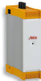
Código: 2401 Inversor ON GRID Steca GRID 300 de 300W