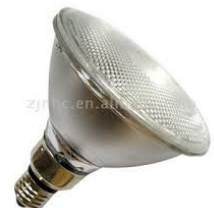
Código : 1107 Foco Iluminación LED PAR38 de 9W con Rosca E-27 para 12 Volt DC