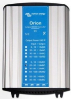
Código: 8003 Convertidor DC-DC VICTRON ENERGY Orion 48/24 -15A Aislamiento galvánico